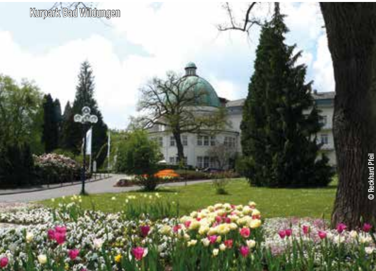
Kurpark Bad Wildungen