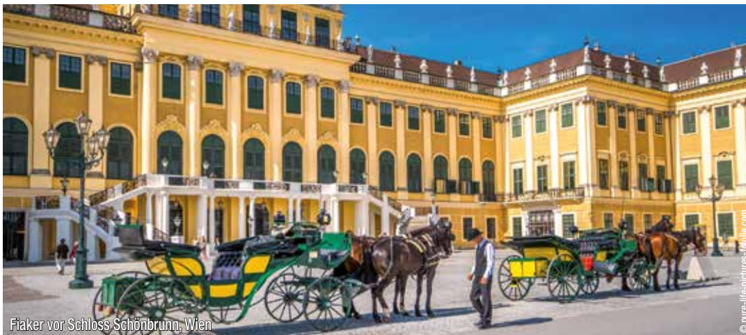
Fiaker vor Schloss Schönbrunn, Wien