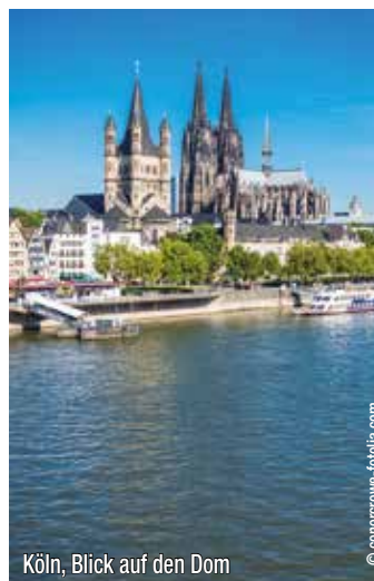
Köln, Blick auf den Dom