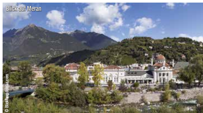
Blick auf Meran

malerischen Altstadt kennen, bummeln durch die Lauben und erleben den farbenprächtigen