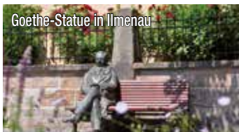
Goethe-Statue in Ilmenau