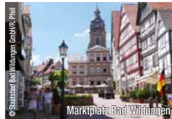
Marktplatz Bad Wildungen