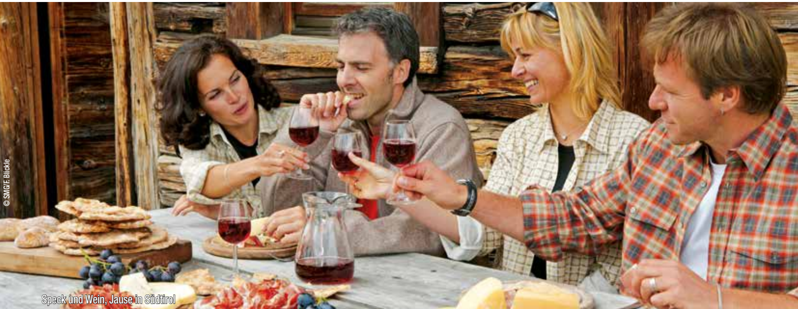
Speck und Wein, Jause in Südtirol