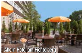
Ahorn Hotel am Fichtelberg

Die imposantesten Burgen und Schlösser aus dem mittleren Erzgebirge möchten wir mit Ihnen auf dieser Burgentour vorstellen. Da Sie unweit der tschechischen Grenze wohnen, ist es ein „Katzensprung“ in die Böhmisches Bäder Karlsbad und Marienbad.