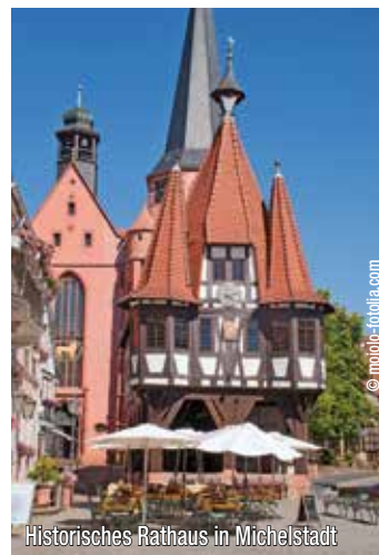
Historisches Rathaus in Michelstadt

Sie wohnen im familiär geführten Hotel mit Restaurant, Gastraum und Aufenthaltsraum mit TV. Das Haus verfügt über Standardzimmer mit DU/WC (teilweise Mansarde), TV und Telefon. Die Zimmer der Kategorie Komfort (nur Doppelzimmer) sind größere, renovierte Zimmer mit DU/WC, TV, Telefon und Balkon. Die Zimmer sind auf 2 Etagen verteilt, kein Lift im Haus. Das Hotel zeichnet sich durch seine gute Küche (eigene Schlachtung) aus. www.sonne-schollbrunn.de