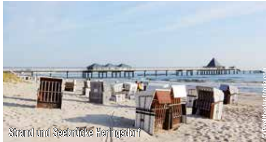
Strand und Seabücke Heringsdorf