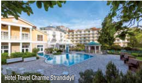
Hotel Travel Charme Strandidyll