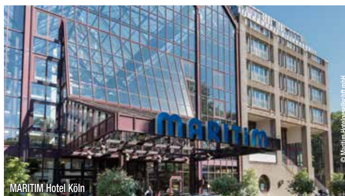
MARITIM Hotel Köln

Genießen Sie das reichhaltige Frühstücksbuffet im Hotel. Im Anschluss haben Sie noch Zeit für einen Bummel durch die Innenstadt von Köln oder zur Dombesichtigung. Die Zimmer müssen bis 12.00 geräumt sein, das Gepäck kann bis zur Busabfahrt deponiert werden. Gegen 14.00 Uhr erfolgt dann die Rückfahrt ab Köln mit Ankunft in den Heimatorten am späten Nachmittag.