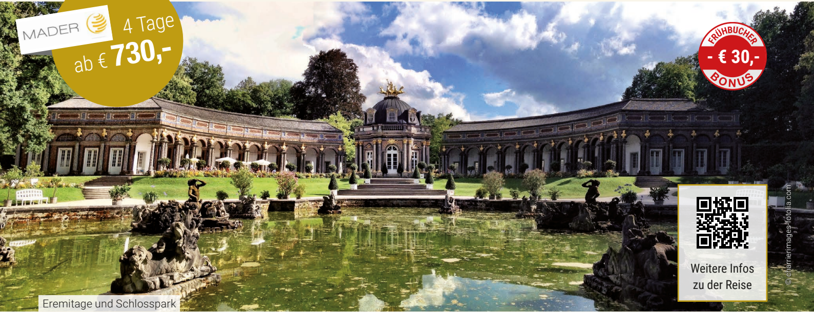
Eremitage und Schlosspark