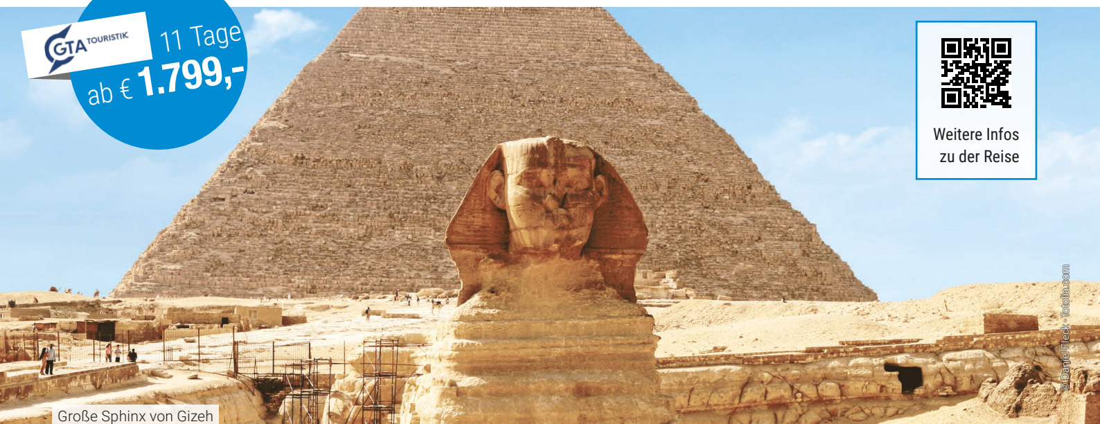
Große Sphinx von Gizeh