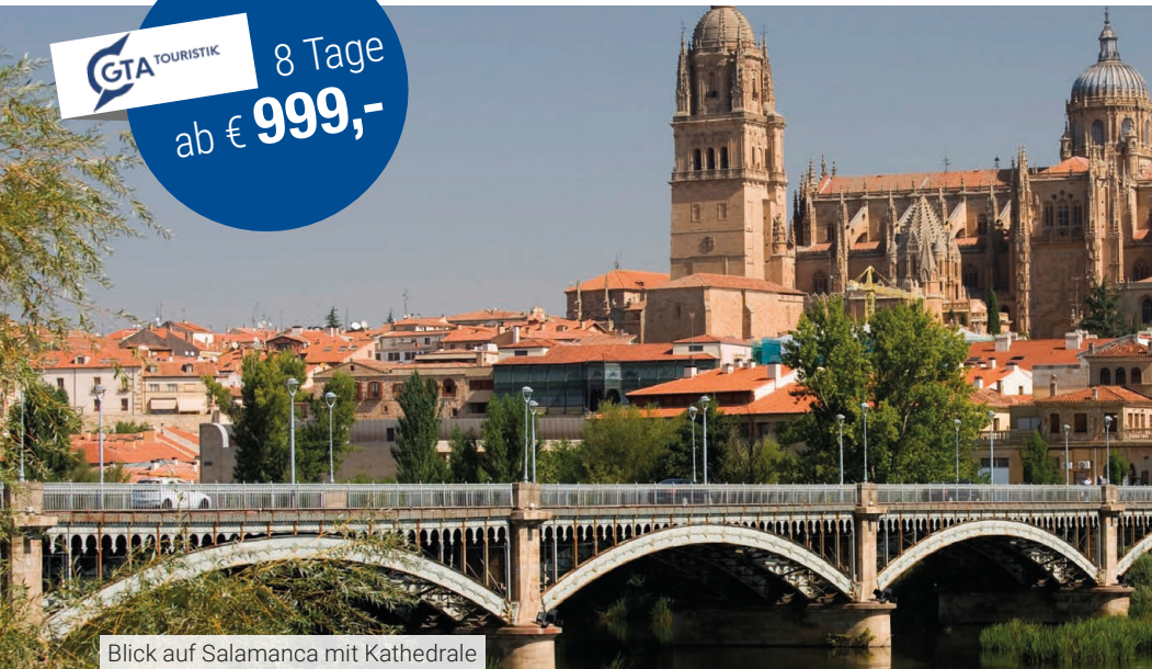
Blick auf Salamanca mit Kathedrale