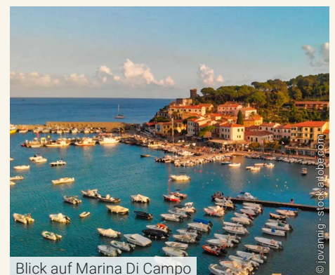
Blick auf Marina Di Campo