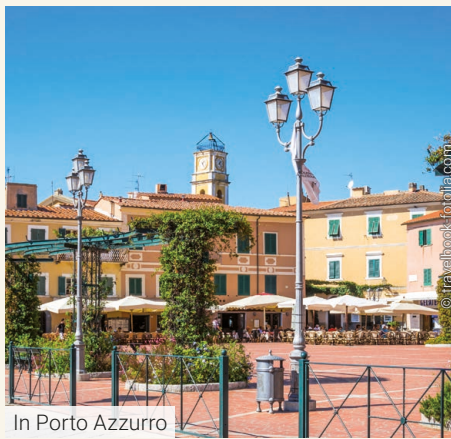
In Porto Azzurro

1. TAG: Salzburg - Innsbruck - Mantua - Parma Anreise vorbei an Salzburg und Innsbruck und über den Brenner nach Südtirol. Vorbei an Brixen und Bozen nach Verona. Nun weiter Richtung Süden nach Mantua. Kurzer Spaziergang zur berühmten Kirche Sant Andrea, zur Piazza delle Erbe sowie zum Palazzo Ducale an der Piazza Sordello. Weiterfahrt nach Parma. A. N. im Hotel Parma & Congressi