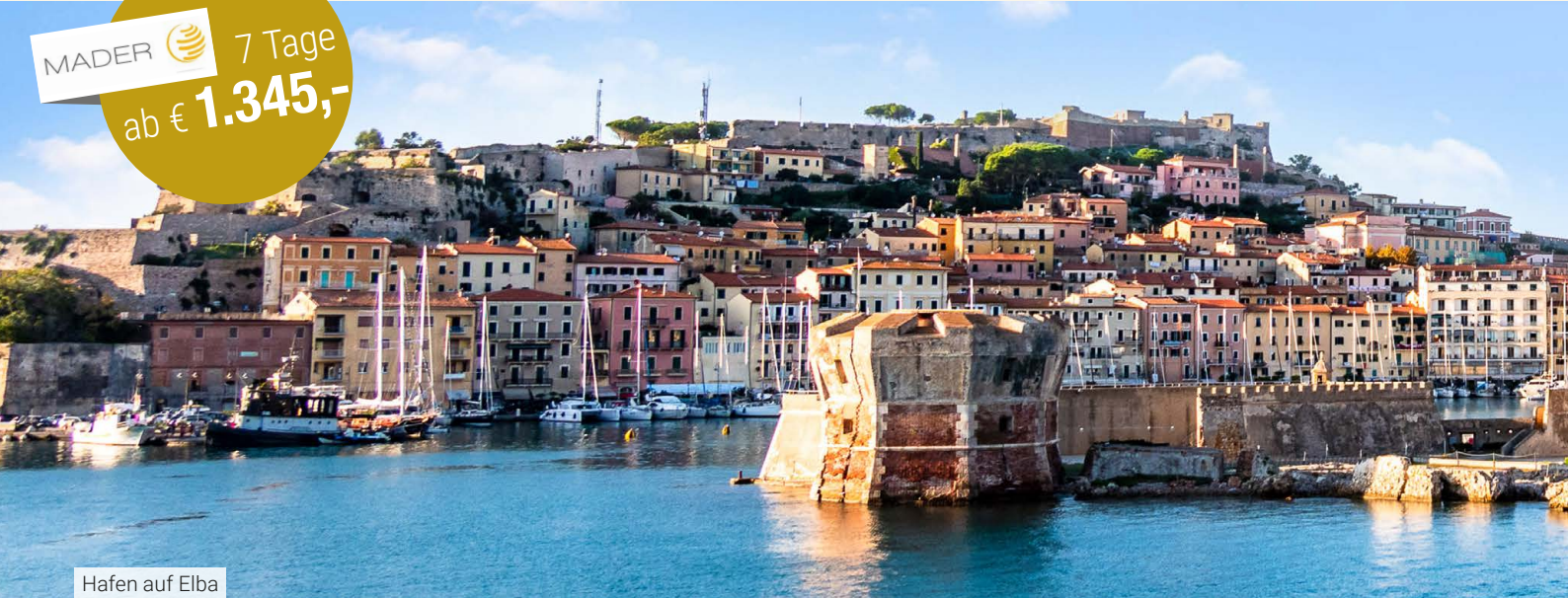
Hafen auf Elba